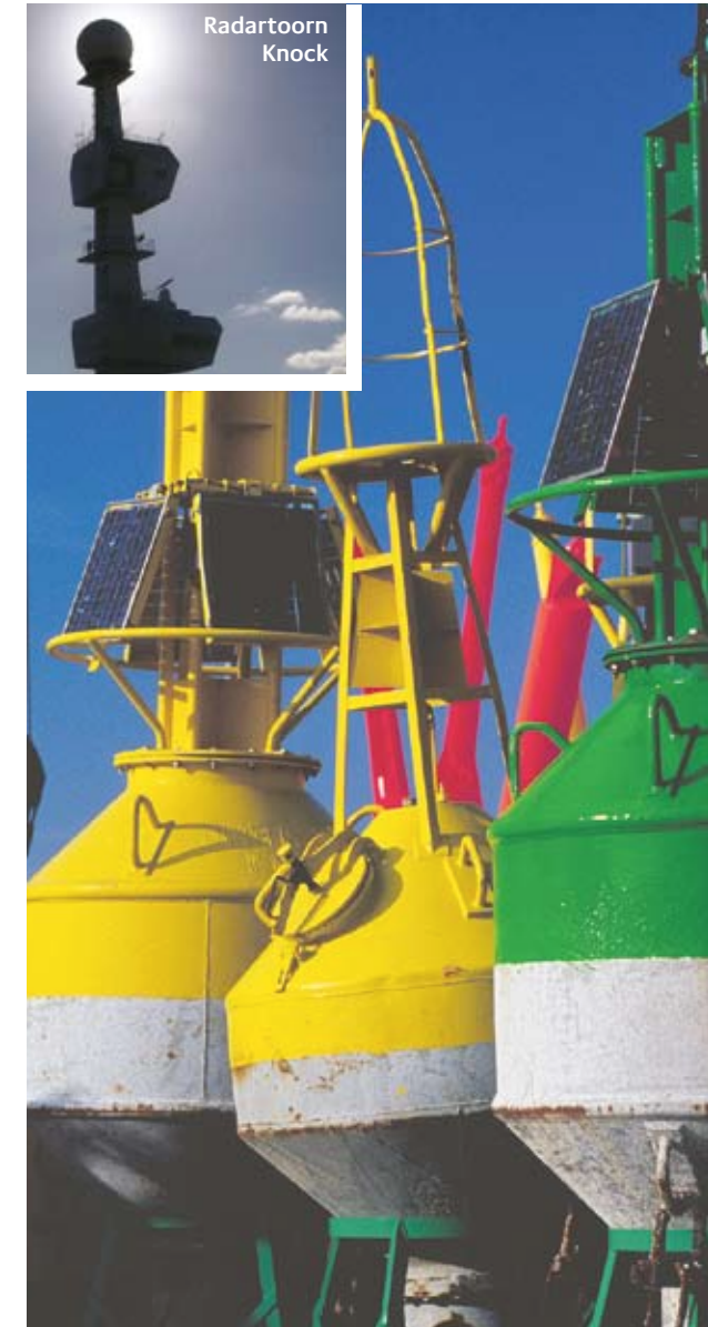
Führtünnen up d' Tünnenhof