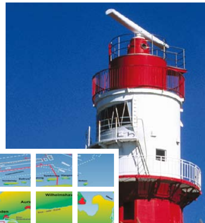
Lüttje Füürtoorn Borkum